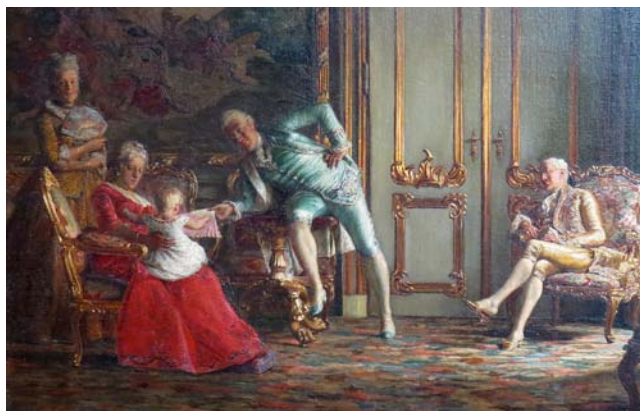
KR. ZAHRTMANN, DEN HIRSCHSPRUNGSKE SAMLING